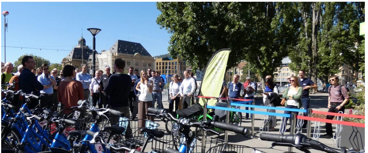
Rencontre d'information du Forum vélostations Suisse : visite de la vélostation de Neuchâtel et de la station de location de vélos du port